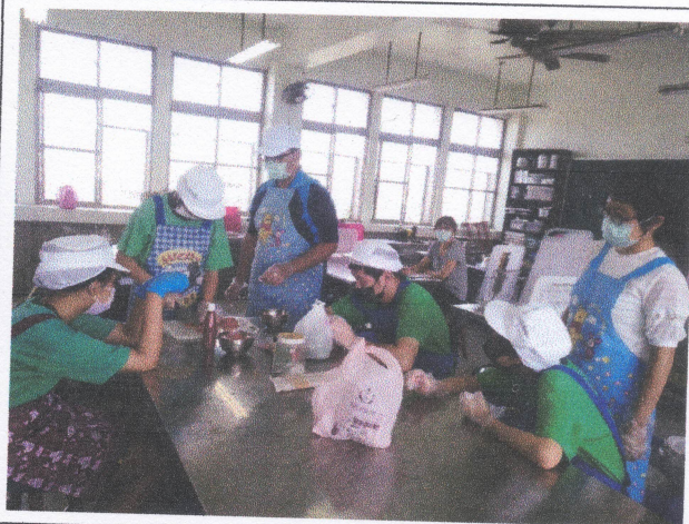
觀課（教學觀察）照片