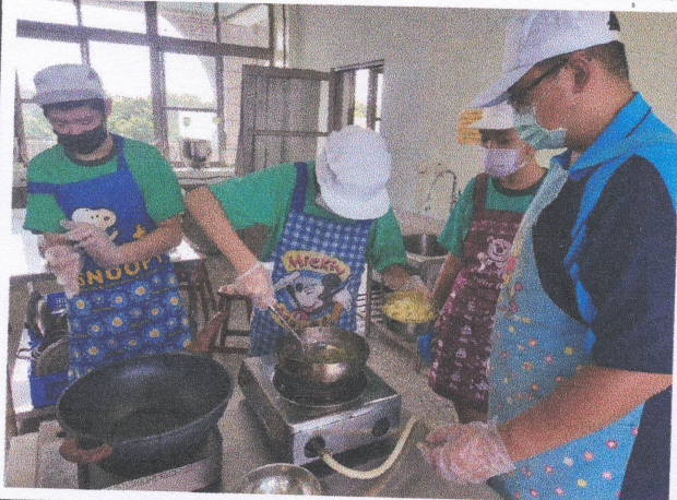
觀課（教學觀察）照片