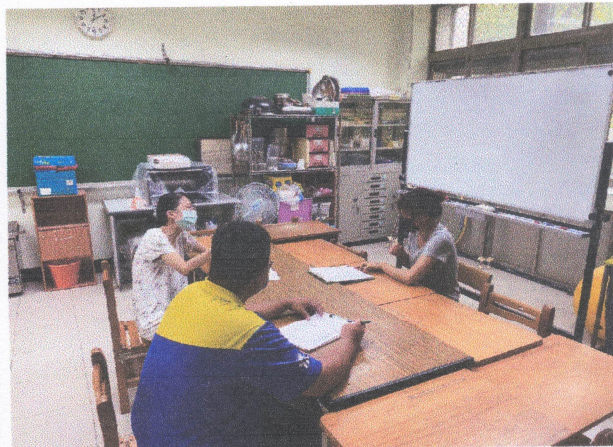
專業回饋（議課）照片