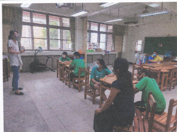
觀課（教學觀察）照片