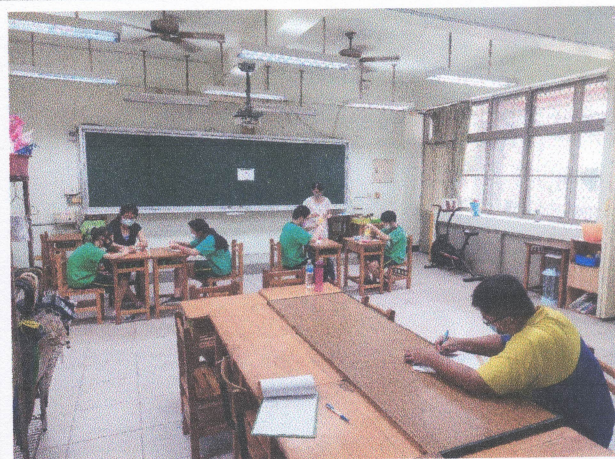
觀課（教學觀察）照片